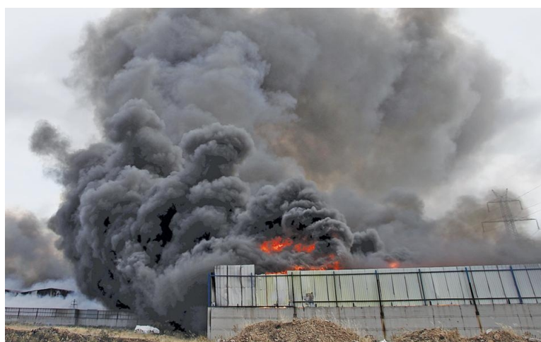
Ιούνιος 2015: το ΚΔΑΥ Ασπροπύργου καίγεται